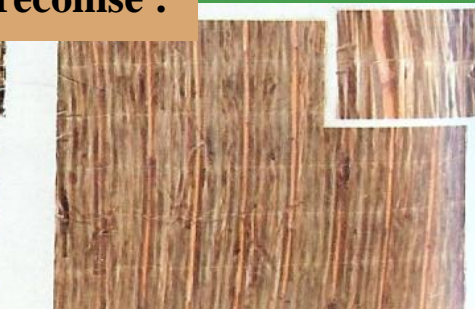
Mélanges Bambous et Osiers